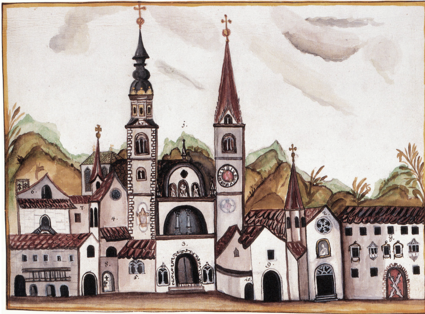
Der Brixener Dom zur Zeit Sätzls. Links der neu errichtete frühbarocke Nordturm. Darstellung aus dem frühen 17. Jh., Kopie um 1790 im Codex Mayrhofen , Diözesanarchiv Brixen.