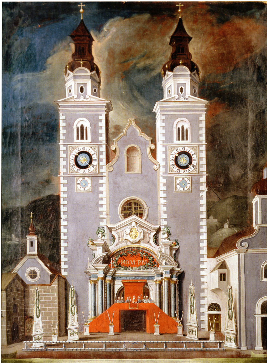
Der Dom im Mai 1782. Dekoration am Eingang anlässlich des Besuchs von Papst Pius VI. Diözesanmuseum Brixen

Fassade und Türme wurden um die Mitte des 18. Jahrhunderts symmetrisch angeglichen, der Dom innen zu grossen Teilen umgebaut und neu dekoriert. Einweihung 1758.